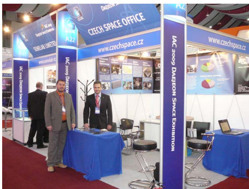
Obrázek 2 - stánek CSO v jihokorejském Daejeonu

Cílem konference a doprovodné výstavy byla výměna informací mezi odbornou veřejností, průmyslem a univerzitami s cílem identifikovat hlavní aspekty a přínosy kosmických technologií.