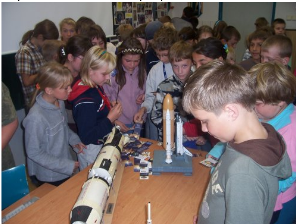
Obrázek 3 - beseda o kosmonautice, Základní škola Proseč